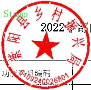
2022年部门综合预算一般公共预算支出明细表（按支出功能分类科目-不含上年结转）