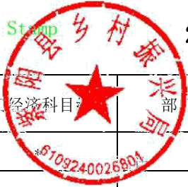
2022年部门综合预算一般公共预算基本支出明细表（按支出经济分类科目-不含上年结转）