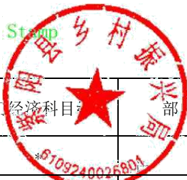
2022年部门综合预算一般公共预算基本支出明细表（按支出经济分类科目-不含上年结转）