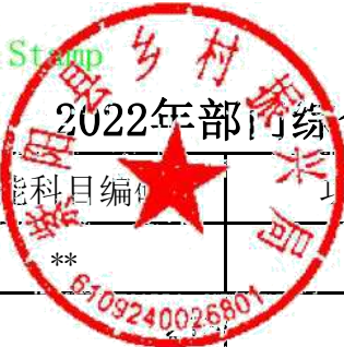
2022年部门综合预算一般公共预算基本支出明细表（按支出功能分类科目-不含上年结转）